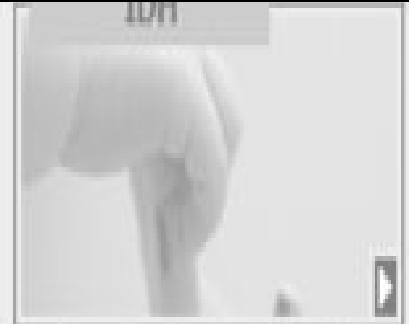
Crescimento Bruto de IDH